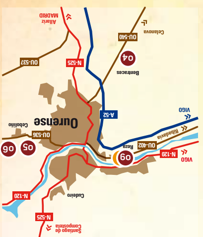
Locais fóra do centro urbano

Lexenda ● Participantes con Menú ● Participantes no Concursos de Pinchos